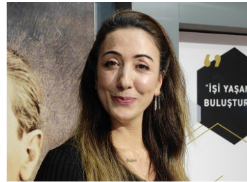
Sunucu Lale Engin